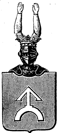
Herb Powąła (Ogończyk).