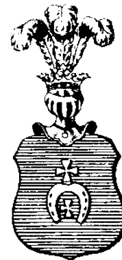
ABRAMOWICZ, cz. Lubicz odm.