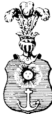
ABRAHAMOWICZ, cz. Kotwica odm.